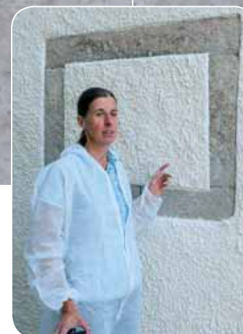
▲ Außenseite der Gruft nach der Sanierung des Kirchenbaus. Bei der Putzabnahme durch die Baufirma konnte, in Zusammenarbeit mit der Diplom-Restauratorin, ein erhaltenes Fenstergewände der Gruft freigelegt werden.